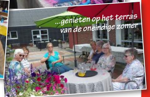
...genieten op het terras van de oneindige zomer