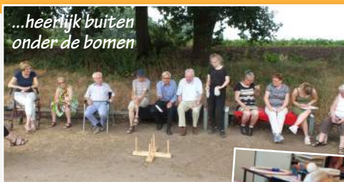
...heerlijk buiten onder de bomen