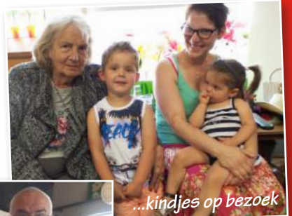
...kindjes op bezoek