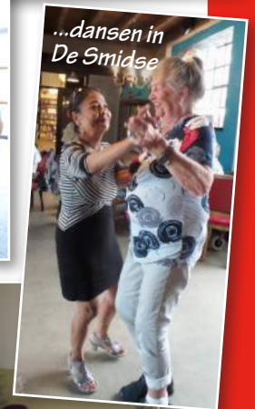
...dansen in De Smidse