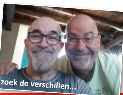
zoek de verschillen...

hetzelfde: er gebeurt altijd wel wat! Het is erg gezellig, vooral als we met alle gasten, vrijwilligers en chauffeurs koffie drinken. Op dit moment zijn er bij De Fabriek dingen die veranderen: de uitbreiding van de activiteiten, en de bouw van de zorgwoningen die eraan zit te komen. Maar de gezelligheid, die blijft! Ik hoop dan ook dat ik nog heel lang